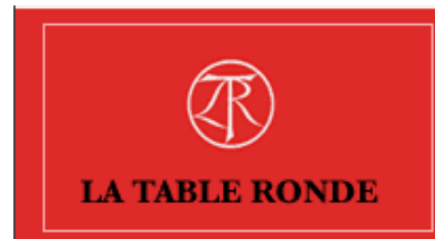
Table Ronde :

Site Internet : http://www.editions-dialogues.fr/